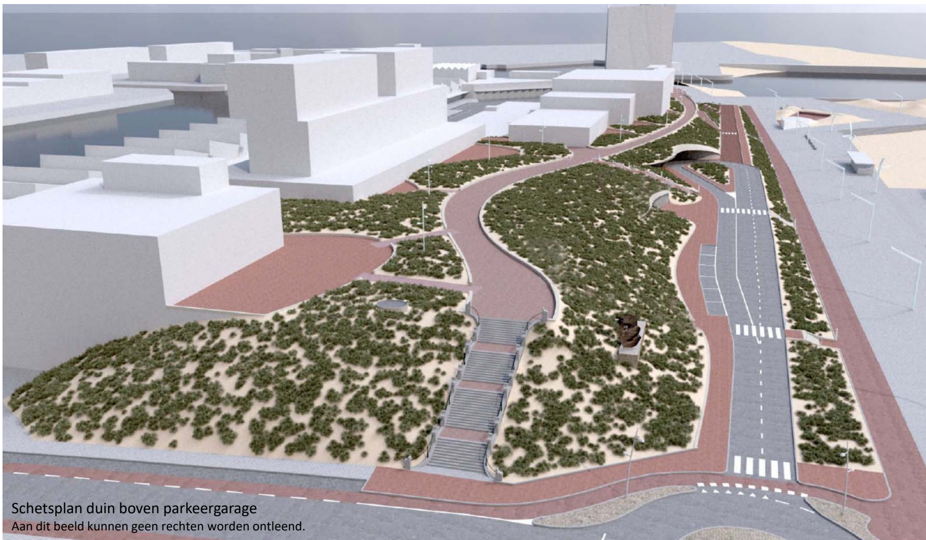
Schetsplan duin boven parkeergarage Aan dit beeld kunnen geen rechten worden ontleend.