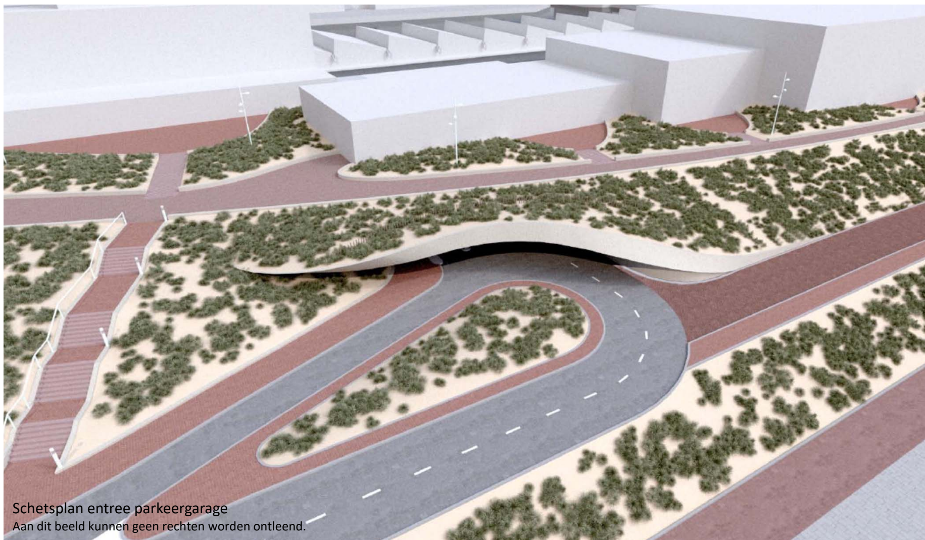
Schetsplan entree parkeergarage Aan dit beeld kunnen geen rechten worden ontleend.