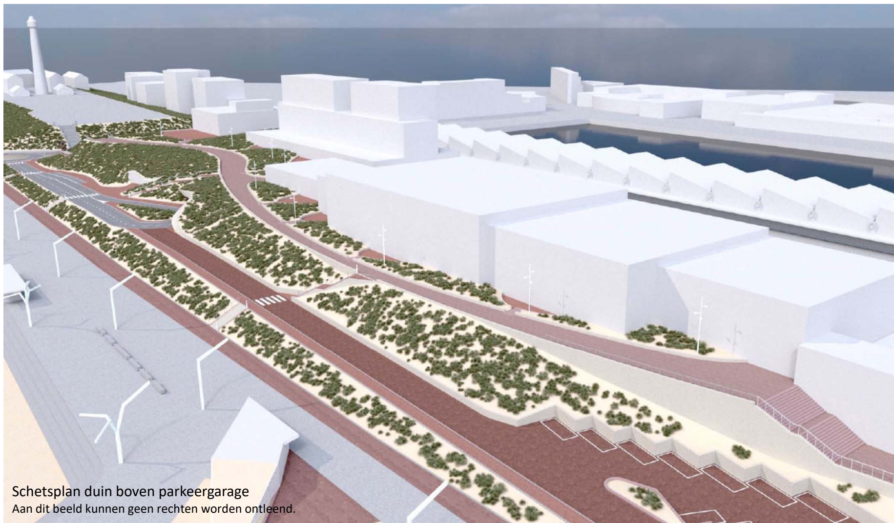
Schetsplan duin boven parkeergarage Aan dit beeld kunnen geen rechten worden ontleend.