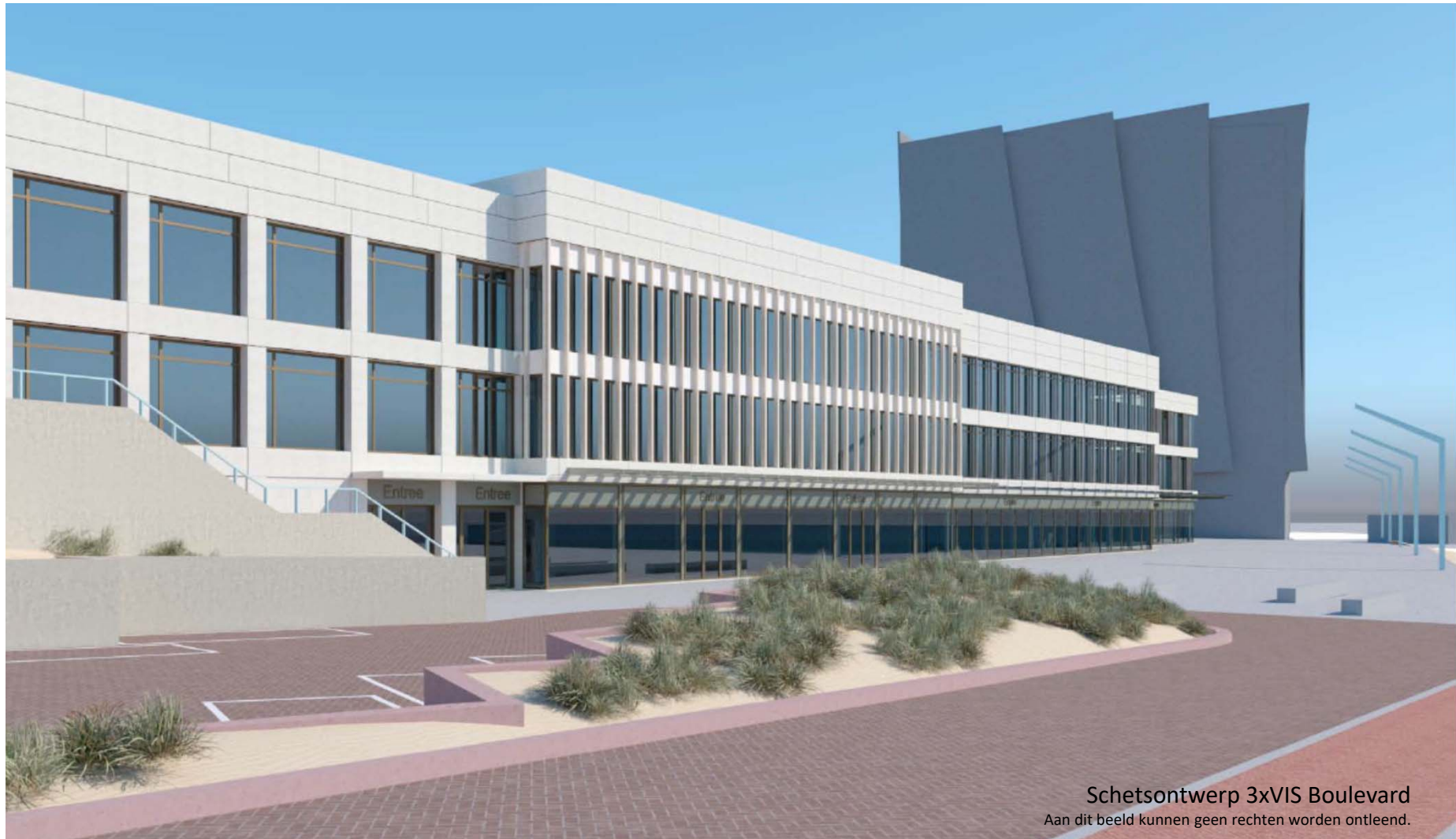
Schetsontwerp 3xVIS Boulevard Aan dit beeld kunnen geen rechten worden ontleend.

3xVIS Boulevard – Horeca, Winkels en kantoren