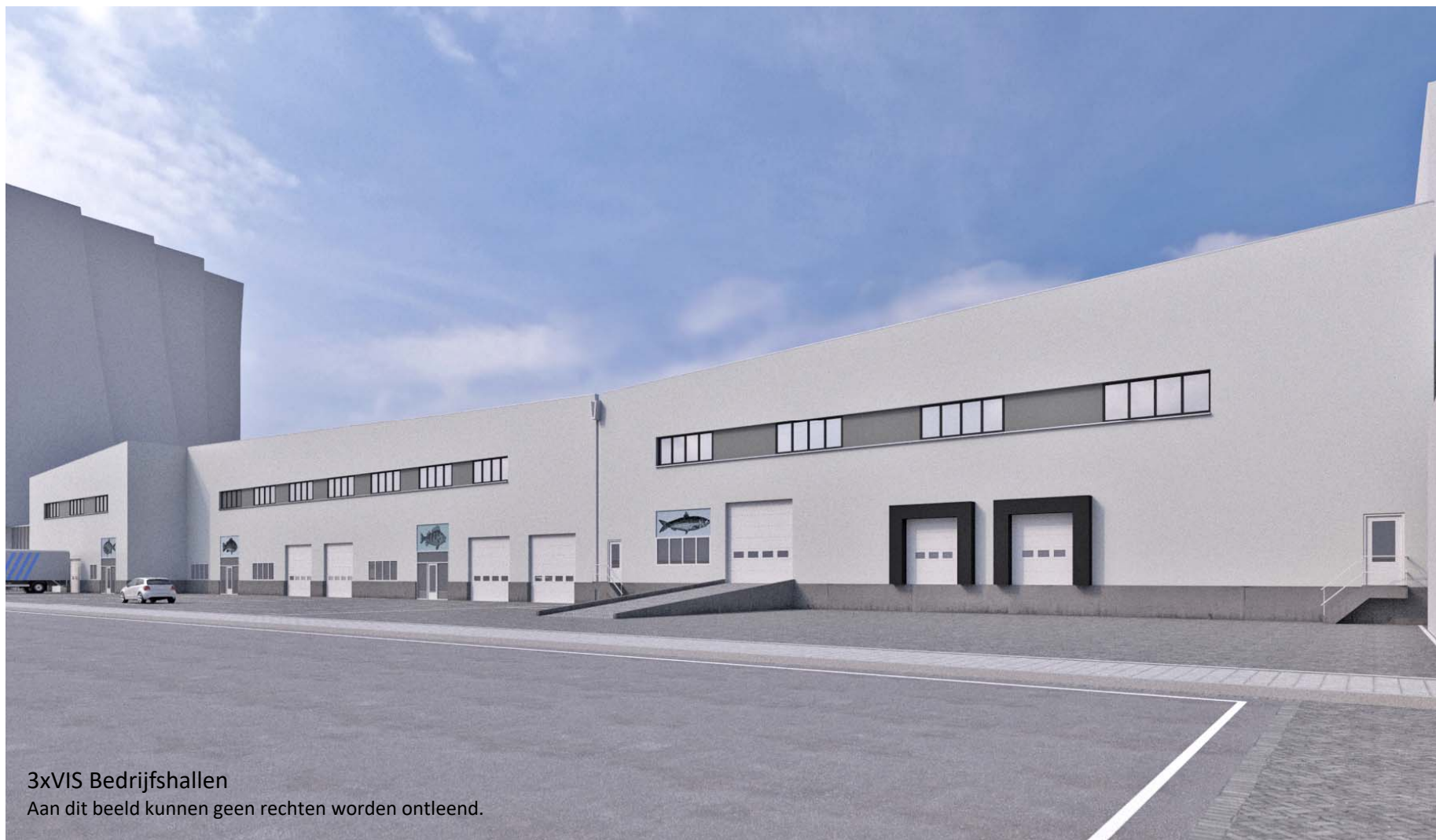
3xVIS Bedrijfshallen Aan dit beeld kunnen geen rechten worden ontleend.